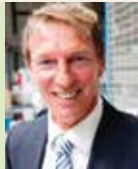
Bernd Jannack MAYWEG GmbH