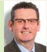
Torsten Urban Kunststoff-Institut für die mittelständische Wirt- schaft NRW GmbH